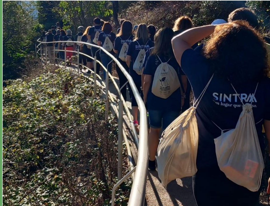
Caminhada Solidária 10 Anos de Sintra Incluir