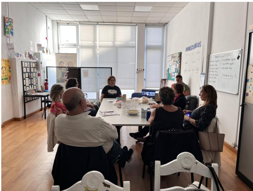
Sessão de Pais

Escrever para Agir: projeto destinado às famílias dos jovens/adultos apoiados pelo Núcleo de Aveiro da Pais em Rede - Associação e teve dois grandes motivos de existir: 1) Pretendeu ser um projeto alinhado com o modelo Psicossocial de entender e intervir na deficiência e incapacidade, ao querer trabalhar com os agentes significativos dos contextos nos quais as pessoas apoiadas se inserem, neste caso as famílias, potenciando o seu papel facilitador nos processos de inclusão; e 2) Reaproximar as famílias em relação ao Núcleo, mas também entre si.