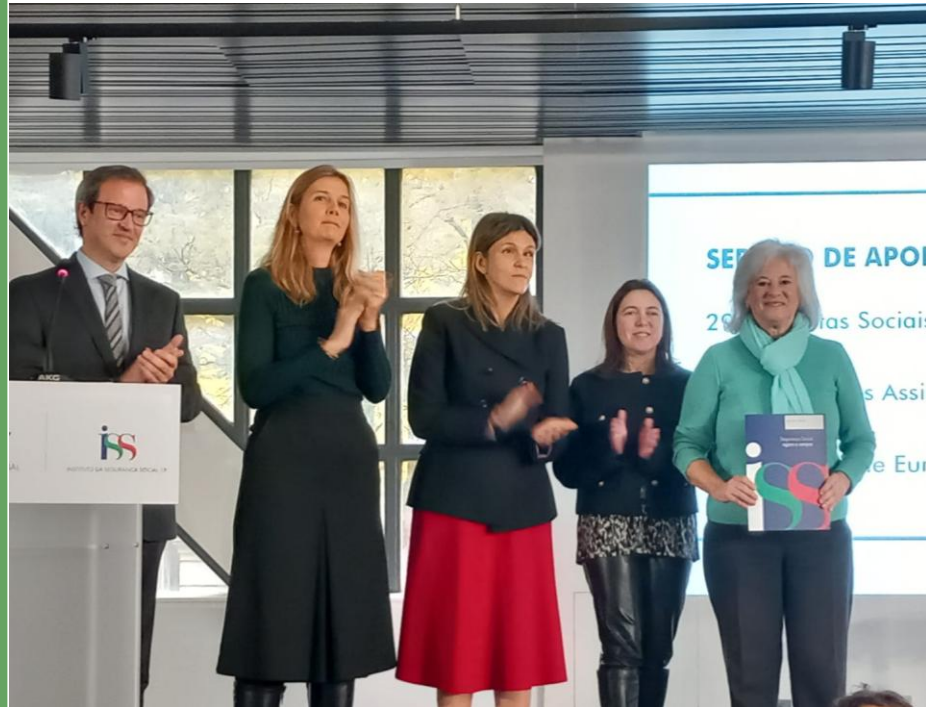
Assinatura do Protocolo com a Segurança Social