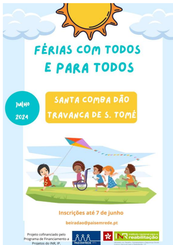
Cartaz de divulgação do Projeto

Projeto de ocupação de tempos livres com atividades desportivas, artísticas, culturais e lúdicas, durante as férias, promovendo a sua inclusão social e ocupação saudável dos tempos livres. Envolvimento de toda a comunidade.